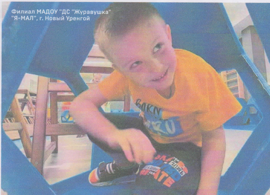
Филиал МАДОУ "ДС "Журавушка" "Я-МАЛ", г. Новый Уренгой

К ак позволить ребенку быть собой? Как отдать ему ту степень свободы, которая будет во благо, поможет раскрыться и быть счастливым сегодня, сейчас, а не только в завтрашнем школьном дне? Метатема года, связующей нитью прошедшая через три номера «Обруча»... В завершающем открываем нашим читателям ее яркую грань, кульминационные смыслы: актуальность и особую ресурсность детского риска.